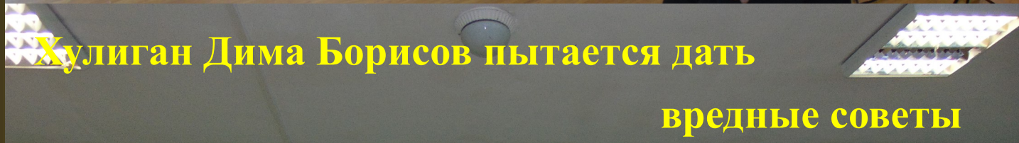
Хулиган Дима Борисов пытается дать