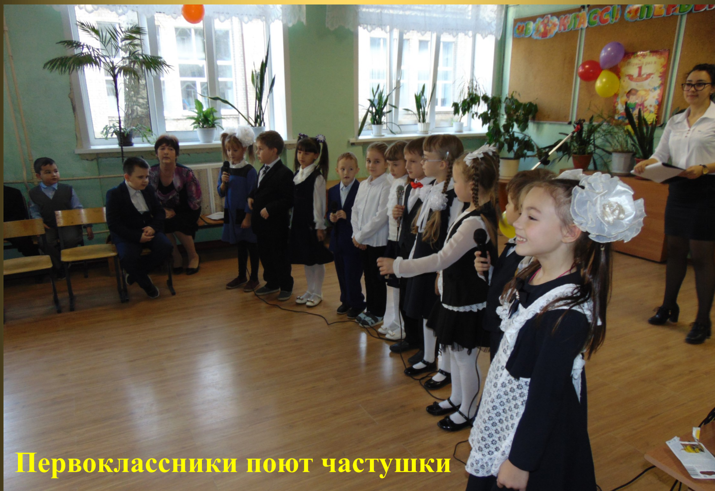
Первоклассники поют частушки