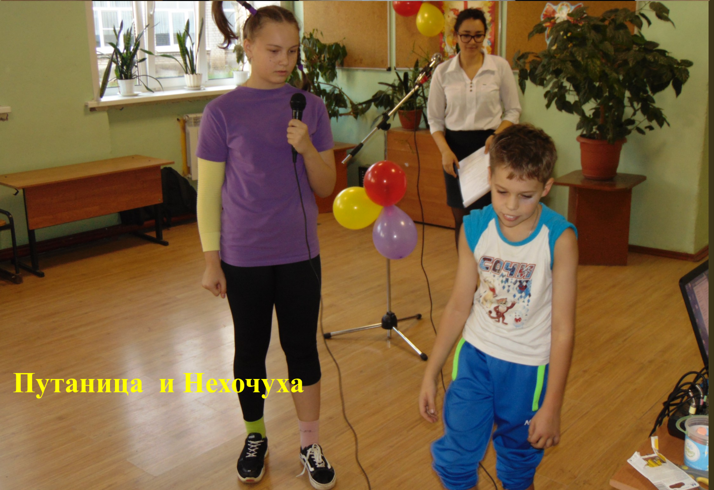
Путаница и Нехочуха